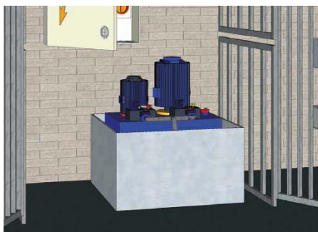
Bac de rétention non contractuel (non fourni)

Il est recommandé que la centrale hydraulique et le coffret de manœuvre soient tous deux installés dans un local fermé, éclairé, ventilé et réservé à l'élèveur