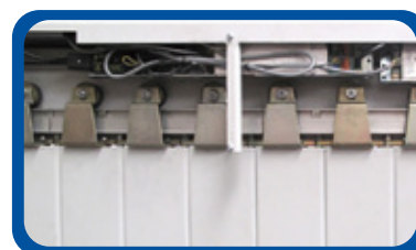
Système de gestion et configuration.