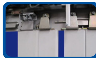
Assemblage des panneaux.