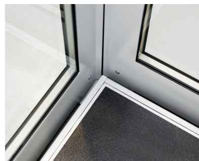
Bords sensibles autour du plancher.