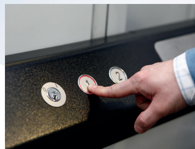
Fonctionnement par action maintenue.